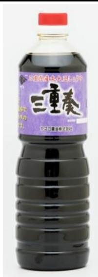
三重県産丸大豆醤油