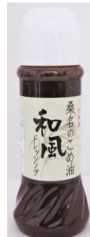
桑名のこめ油ドレッシング