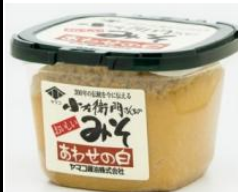
小左衛門さんちのみそ