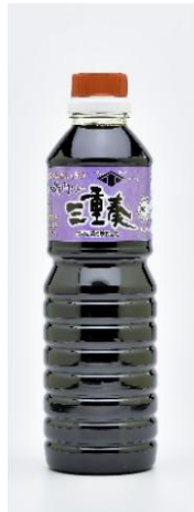
三重県産丸大豆醤油