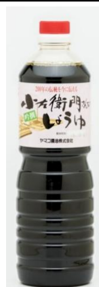
小左衛門さんちの醤油吟選