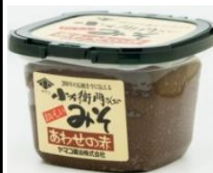
小左衛門さんちのみそ