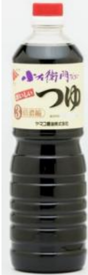
小左衛門さんちのつゆ