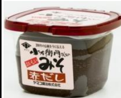
小左衛門さんちのみそ