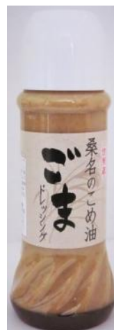
桑名のこめ油ドレッシング