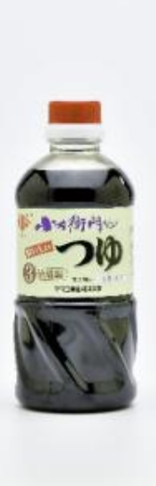
小左衛門さんちのつゆ