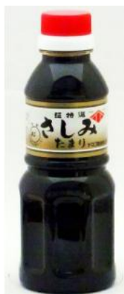
ヤマコ超特選 さしみたまり